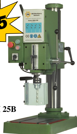
Model SBM 25B